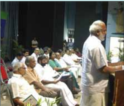
വായനവാരാചരണത്തിന്റെ സംസ്ഥാനതല ഉദ്ഘാടനം വിദ്യാഭ്യാസമന്ത്രി എം.എ.ബേബി നിർവഹിക്കുന്നു.

അസമത്വം ഇല്ലാതാക്കി സാമൂഹികമാറ്റത്തിന് നേതൃത്വം നൽകാൻ വായന അനിവാര്യമാണെന്ന് വിദ്യാഭ്യാസമന്ത്രി എം.എ. ബേബി പറഞ്ഞു. തിരുവനന്തപുരത്ത് ടാഗോർ സെന്ററിനറി ഹാളിൽ വായന വാരാചരണത്തിന്റെ സംസ്ഥാനതലചടങ്ങ് ഉദ്ഘാടനം ചെയ്യുകയായിരുന്നു മന്ത്രി. വായനയെന്ന ഒരു മഹാപ്രസ്ഥാനമാണെന്ന് ചടങ്ങിൽ ആധ്യക്ഷ്യം വഹിച്ച പന്തൂർ രവിന്ദ്രൻ എം.പി. പറഞ്ഞു. പ്രൈമറി വിദ്യാഭ്യാസം പൂർത്തിയാക്കുന്ന ഒരു കുട്ടി മാതൃഭാഷ പഠിച്ചിരിക്കണമെന്ന് വ്യവസ്ഥ ചെയ്യണമെന്ന് ചടങ്ങിൽ സംബന്ധിച്ച പി.ഗോവിന്ദപിള്ള പറഞ്ഞു.